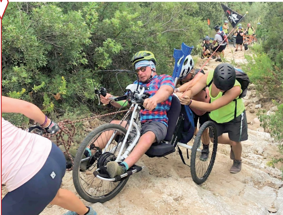
KORSICKÁ EXPEDICE „PŘESBAR“