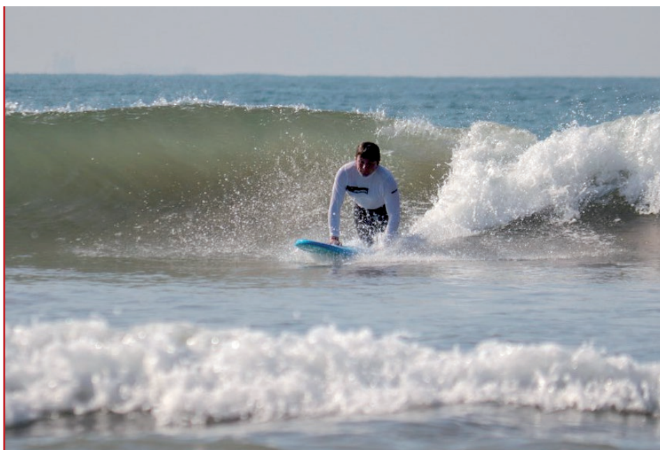
PŘI SURFOVÁNÍ NA SRÍ LANCE V LEDNU 2020

Myslím si, že by se na tom dalo ještě zapracovat. Ergonomii a řešení bariér by mohl být vyhrazen celý předmět. Nicméně si pamatuji, že jsme v prvním ročníku dostali půjčený invalidní vozík a museli jsme natočit video, jak se na něm pohybujeme a zvládáme bariéry, což mi přišlo jako skvělý způsob, jak lidi seznámit s životem vozíčkáře.