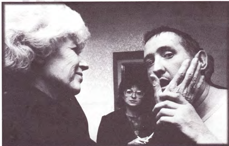
V ústavu sociální péče