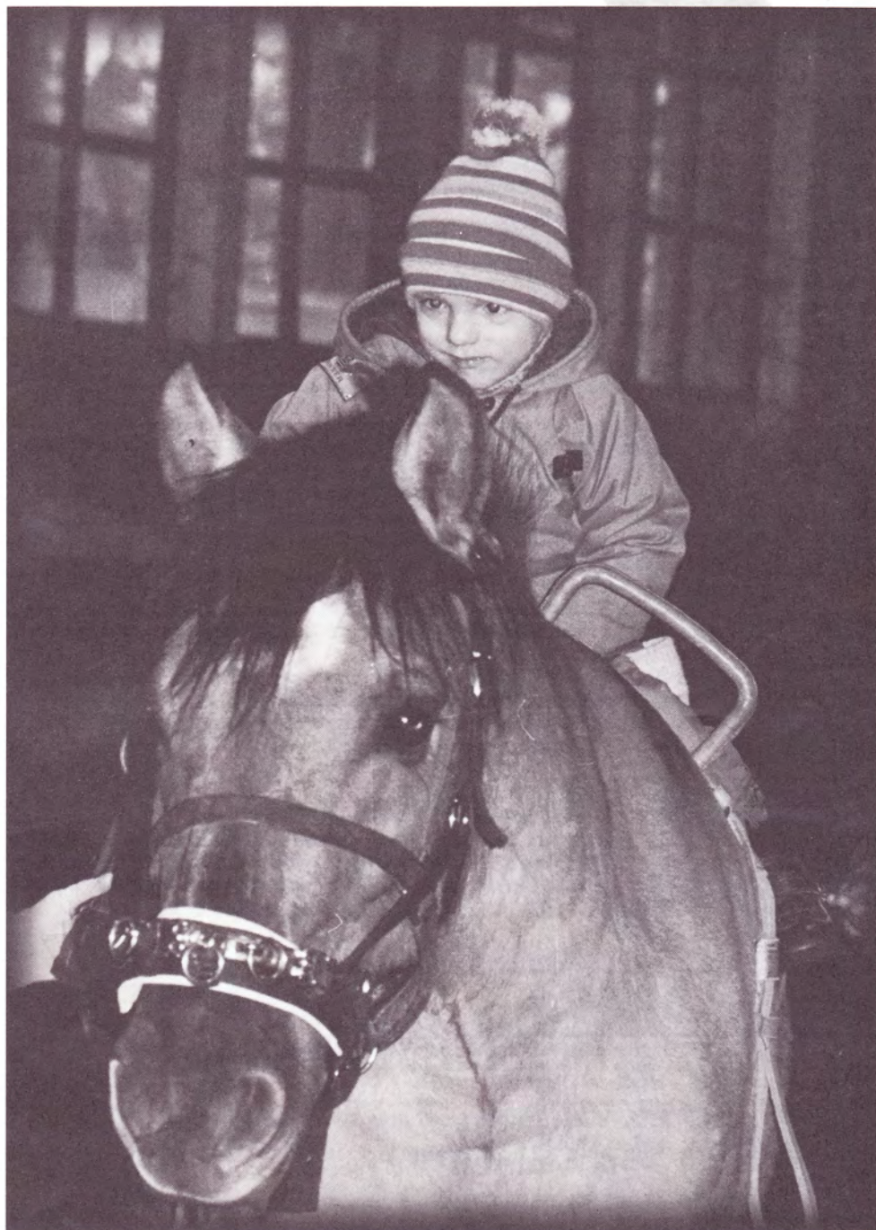
Hipoterapie v Bohnicích