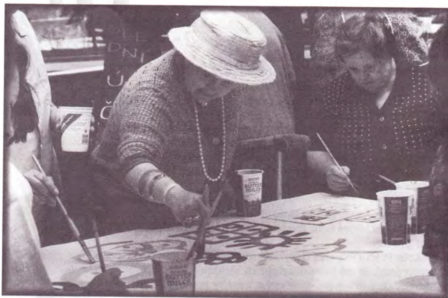
Květiny pro Terezín