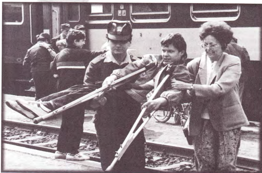
Vlak dobré vůle 1993