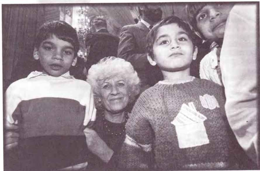
Setkání na Hradě