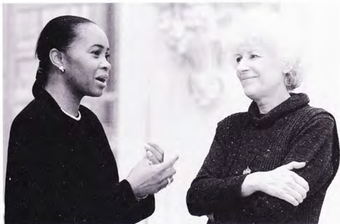
Z pobytu Barbary Hendricks v Praze