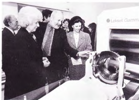
Při návštěvě švédské královny v nemocnici Na Homolce