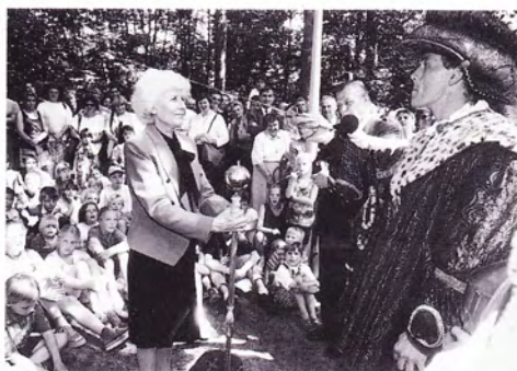
S dětmi v holandském zábavním parku „Země všech dob“