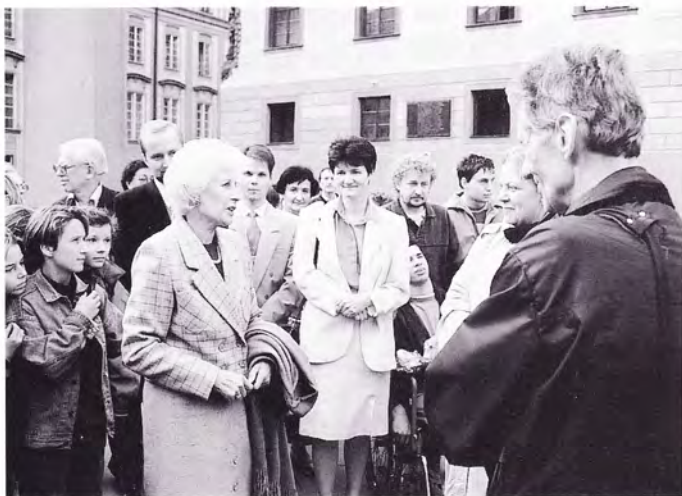
Slavnost předání Sunshine Coach Výboru dobré vůle na Pražském hradě