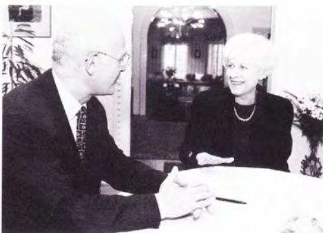
Podpis smlouvy mezi ČEZ, a.s. a Výborem dobré vůle o finančním daru pro klimatické pobyty dětí ze severních Čech, dne 22. listopadu 1995